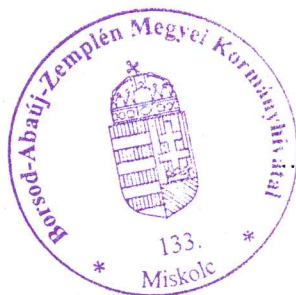
Demeter Ervin kormány megbízott