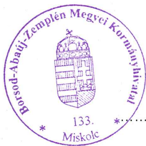
Demeter Ervin kormány megbízott