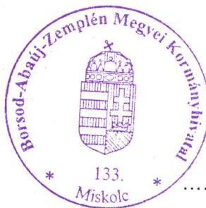
..... Demeter Ervin kormány megbízott