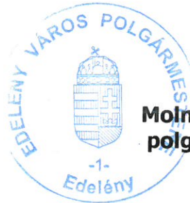
Molnár Oszkár polgármester