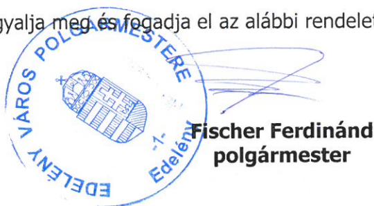
Fischer Ferdinánd polgármester

Kérem a Képviselő-testületet, hogy tárgyalja meg és fogadja el az alábbi rendelettervezet. Edelény, 2024. november 22.