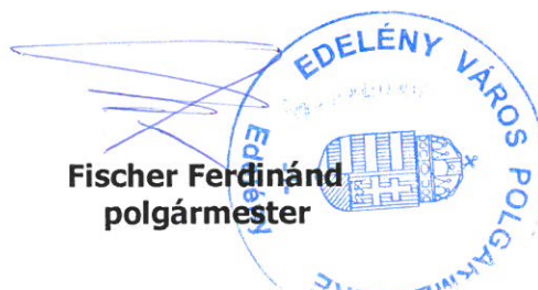
Fischer Ferdinánd polgármester