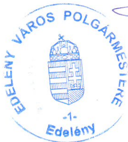
Fischer Ferdinánd polgármester