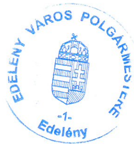
Fischer Ferdinánd polgármester