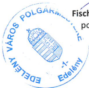
Fischer Ferdinánd polgármester