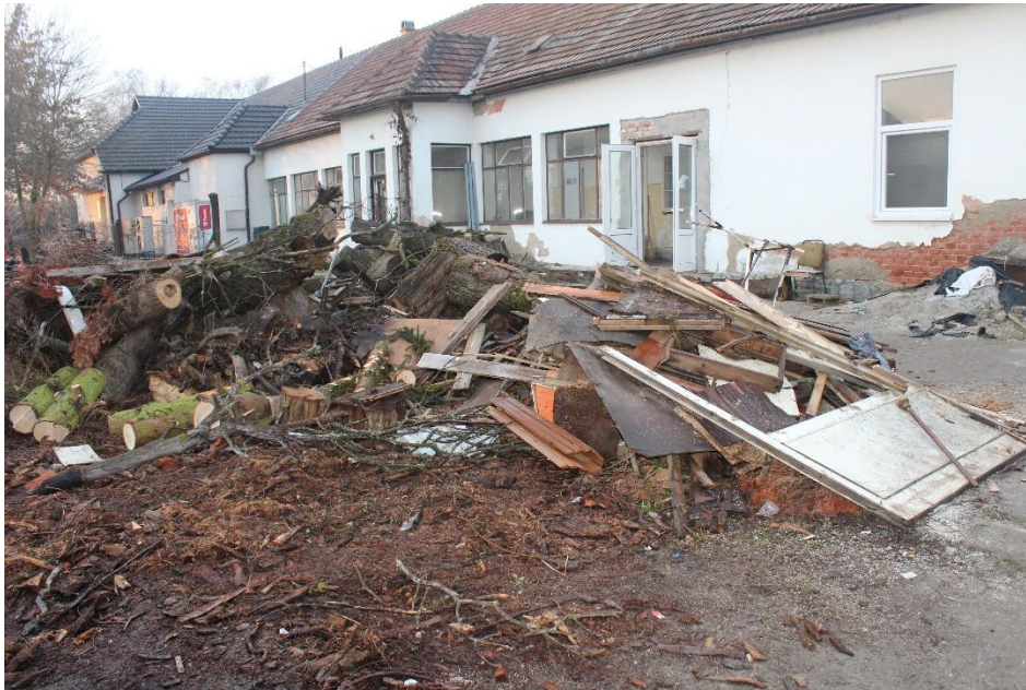
Telephely Borsodi út 26. utána