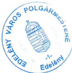
Fischer Ferdinánd polgármester