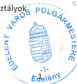
Fischer Ferdinánd polgármester